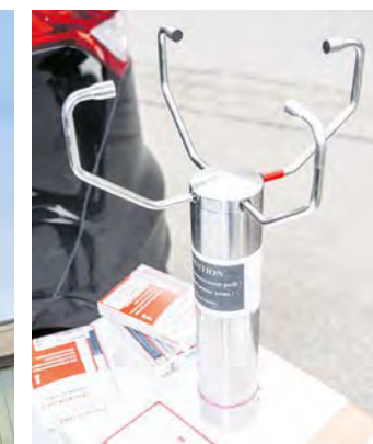
▶ Bei Wind und Wetter. Moderne Messgeräte liefern wichtige Daten.