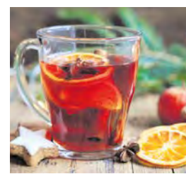
Geidorf. Die Grätzelninitiative Margaretenbad lädt zu Punsch und mehr.