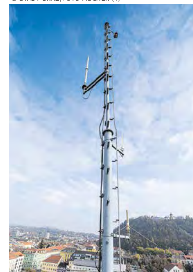
▶ Himmelhoch. Klima- und Wetterstation in 36 Meter Höhe auf dem Mast der Grazer Berufsfeuerwehr.